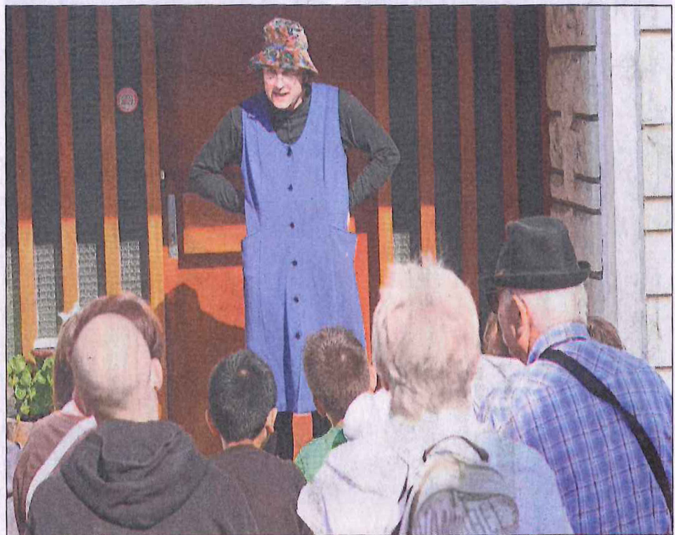
■ Pour affronter l'hilarante Mme Gimbard, rendez-vous dimanche 24 mars à 16 h, Jardin de la Citadelle.

En un circuit bien choisi, dans les jardins, sous les porches ou sur les balcons, on glane les moments de shows, les notes volages ou les envolées théâtrales. Vingt petites minutes là, et les moineaux spectateurs