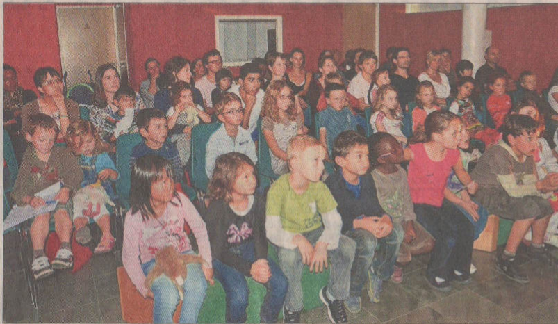
■ Des enfants très attentifs !

Ils étaient très nombreux ce samedi à attendre le spectacle de marionnettes de Vic le Viking par la compagnie Histoire d'Eux. La salle affichait complet à la médiathèque de Vandœuvre. C'est enfant que le metteur en scène a découvert Vic le Viking, un livre jeunesse de Runer Jonsson. Il est alors séduit car il incarne l'intelligence qui triomphe de la force. Sa ruse sort toujours les vikings des mauvais pas où la brutalité les entraîne.