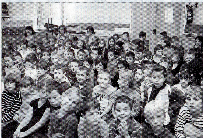
Les "grands" de l'école du Saut-le-Cerf ont eux aussi apprécié ce spectacle de marionnettes, rallongé spécialement pour eux.

Dans l'après-midi, c'était ensuite au tour des élèves de primaire de l'école du Saut-le-Cerf de découvrir ce spectacle dans une version plus longue, adaptée aux plus grands. J.D.