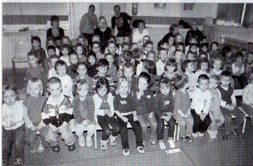
Les petits de la maternelle Guilgot ont bien rigolé avec les aventures de Vic le Viking vendredi matin.