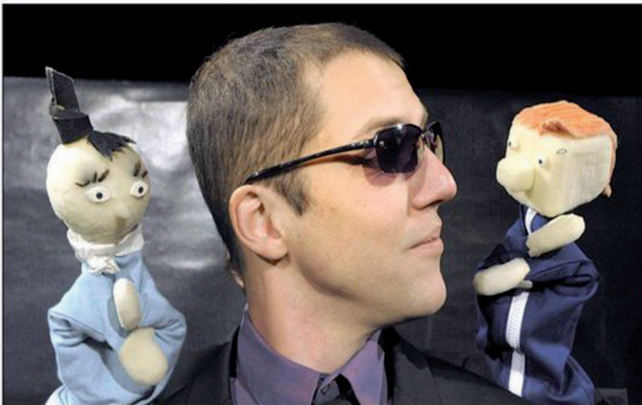
■ La Cie Histoire d'Eux invente la société Marionnetys. Drôle et Effrayant...