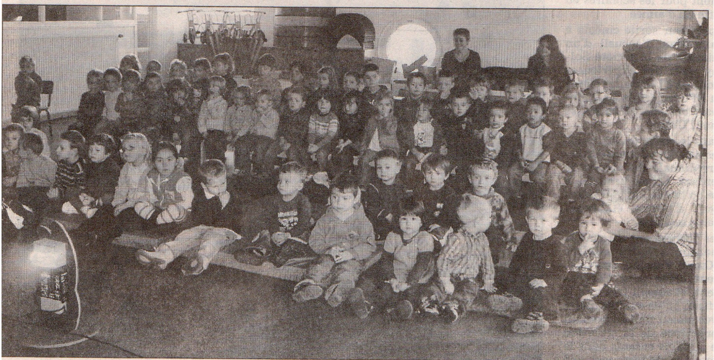
Des enfants enchantés par la prestation de la compagnie des Trois Chardons.

la petite fille de découvrir le monde qui l'entoure, Monsieur le Vent veut souffler un à un les nuages. Mais deux dindons s'y opposent. Les enfants ont vivement apprécié ce spectacle.